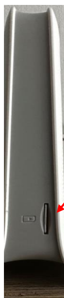
Slot na SIM kartu