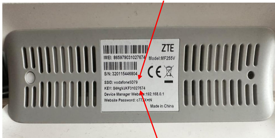
Heslo k Wi-Fi v továrním nastavení